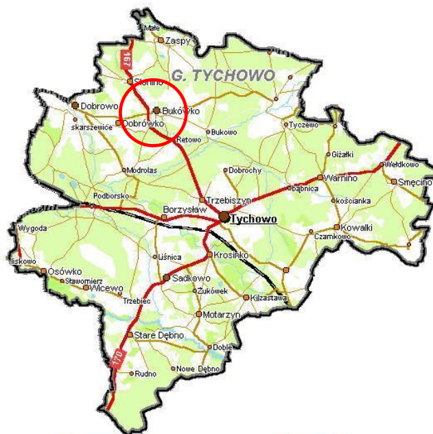
Rysunek Nr 1. Położenie miejscowości w gminie.